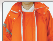
フロント内側 防水布付