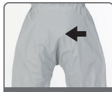
シームレスパンツ