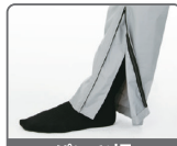
パンツ裾ファスナー付