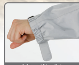
袖口半ゴム半ベルト調節