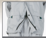
上下両開きファスナー