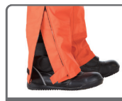
パンツ裾ファスナー 開閉