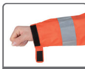
袖口半ゴム半ベルト調節